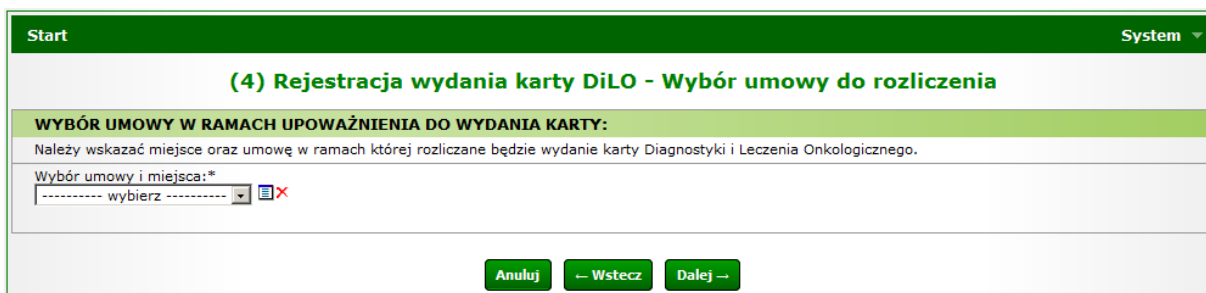
Rysunek 7 Przykładowe okno (4) Rejestracji wydania karty DiLO w AOS

Ostatni krok uzupełniania danych wymaga wybrania umowy i miejsca udzielania świadczeń, w ramach której nastąpi rozliczenie świadczeń związanych z wydaniem karty DiLO.