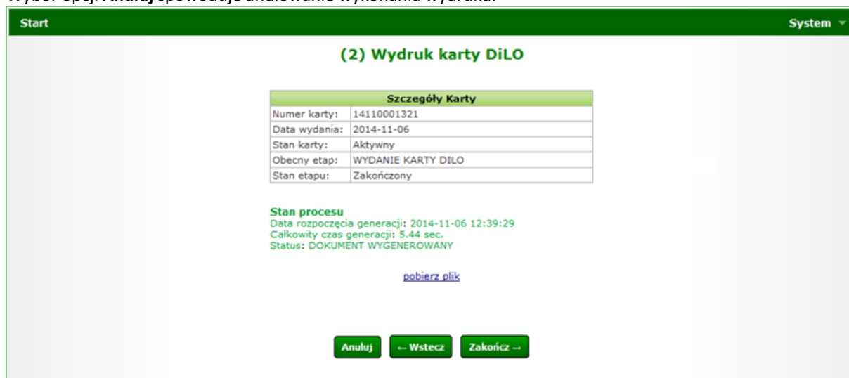
Rysunek 10 Przykładowe okno (2) Wydruku karty DiLO

Wybór opcji Anuluj spowoduje anulowanie wykonania wydruku.