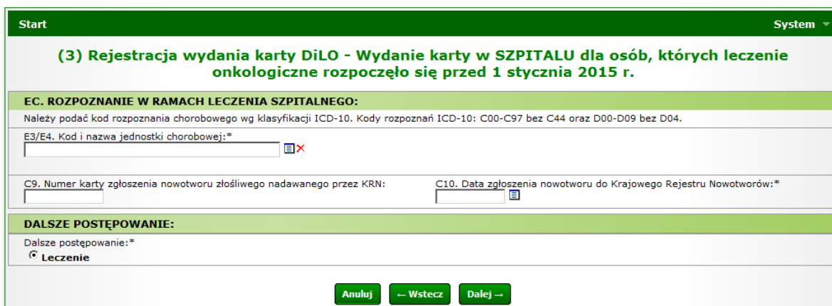
Rysunek 6 Przykładowe okno potwierdzenia wydania karty DiLO w szpitalu - kontynuacja leczenia

W przypadku SZP-KL kolejnym etapem SSO jest Leczenie .